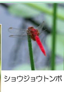
ショウジョウトンボ