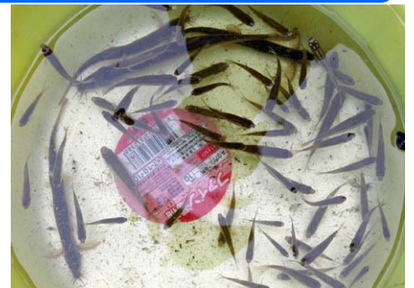
カワハタモロコ・ミナミメダカ・ドジョウ