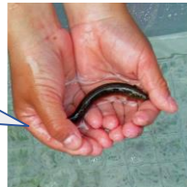
サカナを 観察、触れる