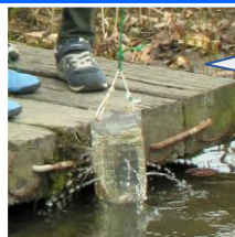
モンドリで サカナを捕獲