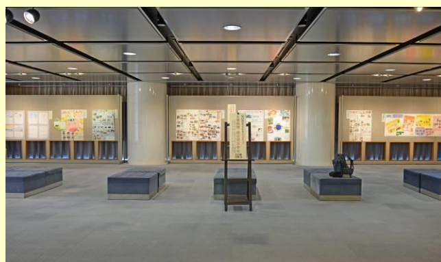
昨年の壁新聞大会の様子（左：こうべ環境未来館 右：市役所市民ギャラリー）