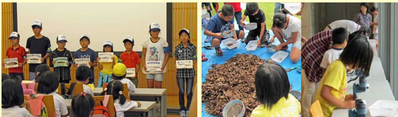
昨年の発表会・特別企画の様子（灘浜サイエンススクエア）