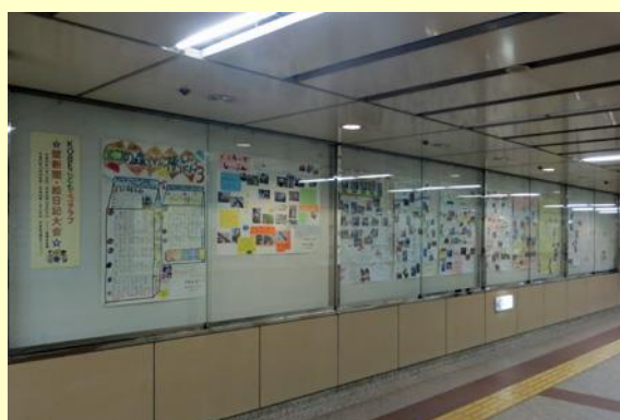
昨年の壁新聞大会の様子（左：こうべ環境未来館 右：花時計ギャラリー）