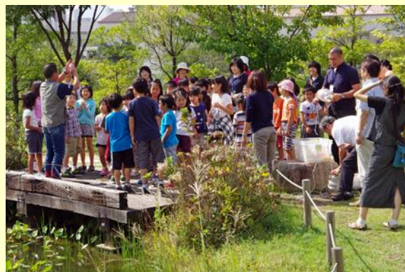
昨年の発表会・特別企画の様子（灘浜サイエンススクエア）