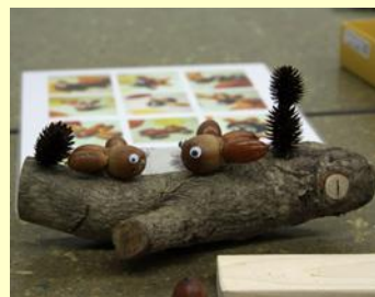
“ふえすた”の様子（左:草木染め、中:ビオトープ、右:ドングリ工作）