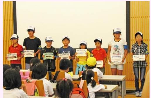
発表風景(平成26年10月)