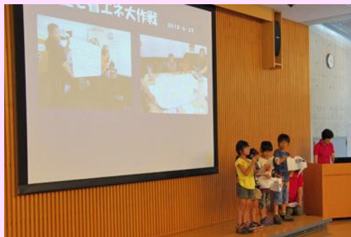
発表風景(平成25年10月)